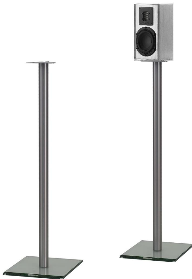
TMicro 40 AMT 用スタンド

ベースプレートを異素材のクリアガラスにし、トッププレートの接触面積を可能な限り小さくしたデザインは、外部からの振動がスピーカー本体へ影響するのを防ぎます。あたかも空中に固定されているかのように設置されたスピーカーは外部レゾナンスから解放され、一段上のパフォーマンスを発揮します。