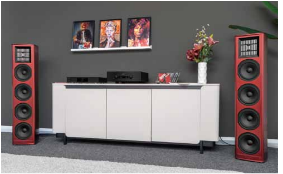
Coax Excellence Series: Bordeaux Red